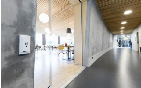
Täyttä esteettömyyttä Musholmin kokous- ja lomakeskuksessa

rakennuksen käyttäjille liikuntarajoitteisiin katsomatta. Rakentamisen aikaan GEZEN paikalliset työntekijät ja Saksan pääkonttorin tuoteasiantuntijat kävivät tiivistä vuoropuhelua rakennuskohteen projektipäälliköiden kanssa. Projektin aikana kehitettiin lukuisia nimenomaan tämän rakennuksen esteettömyyttä varten räätälöityjä ratkaisuja, ja rakennus on samassa käytössä edelleen.